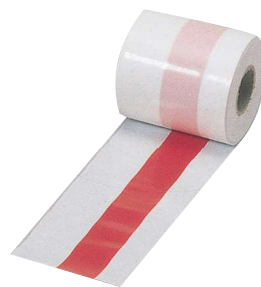
19 000640 厚手ポリ紅白足巻50m巻 W75mm・厚さ0.07mm 1巻 ¥1,100 ポリエチレン 出荷単位:1