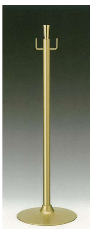
12 055900 テープカットボール(小) H80cm・ベースΦ28cm パイプ径Φ3.2cm・3.6kg 1本 ¥14,500 真鍮 出荷単位:1 送料別商品