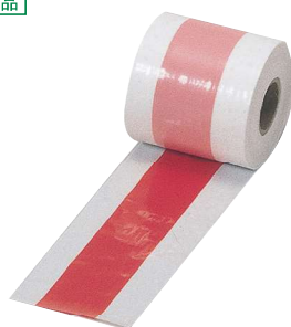
18 000625 ポリ紅白足巻80m巻 W75mm・厚さ0.05mm 1巻 ¥1,400 ポリエチレン 出荷単位:5