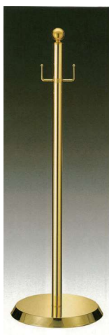
11 055901 テープカットボール(中) H90cm・ベースΦ30cm パイプ径Φ3.2cm・5.2kg 1本 ¥31,000 真鍮 出荷単位:1 送料別商品