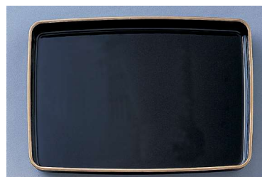
9 054552 プラスチック賞状盆 H4.5×W45×D31cm 1コ ¥9,800 プラスチック 出荷単位:1