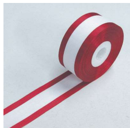
17 000980 1.5"赤耳リボン W36mm・L29m 1巻 ¥1,500 レーヨン・ナイロン 出荷単位:5