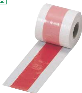
18 000625 ポリ紅白足巻80m巻 W75mm・厚さ0.05mm 1巻 ¥1,400 ポリエチレン 出荷単位:5