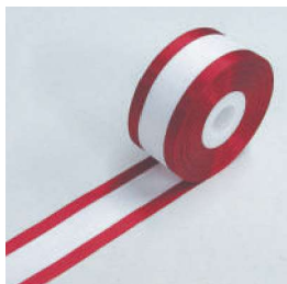
17 000980 1.5"赤耳リボン W36mm・L29m 1巻 ¥1,500 レーヨン・ナイロン 出荷単位:5