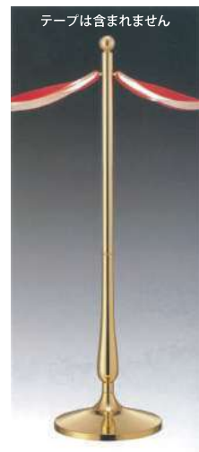
テープは含まれません