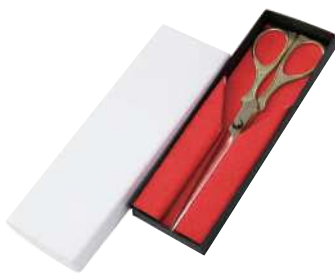
2 056300 ゴールドハサミ L20cm・刃渡り9cm 1本 ¥6,300 表面:金メッキ・刃:ステンレス 出荷単位:1