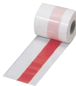
19 000640 厚手ポリ紅白足巻50m巻 W75mm・厚さ0.07mm 1巻 ¥1,100 ポリエチレン 出荷単位:1