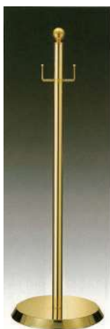
11 055901 テープカットボール(中) H90cm・ベースΦ30cm パイプ径Φ3.2cm・5.2kg 1本 ¥38,000 真鍮 出荷単位:1 送料別商品