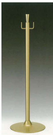
12 055900 テープカットボール(小) H80cm・ベースΦ28cm パイプ径Φ3.2cm・3.6kg 1本 ¥21,000 真鍮 出荷単位:1 送料別商品