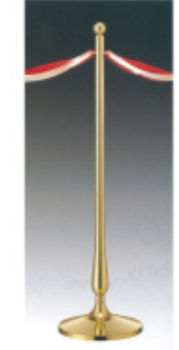
テープは含まれません

10 000672 手袋 フリーサイズ・ホック付 1双 ¥480 綿 出荷単位: ⑫ 480/CTN 11 054552 プラスチック賞状 H4.5×W4.5×D3.1cm 1コ ¥8,800 プラスチック 出荷単位: 1