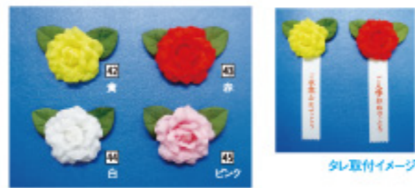
タレ取付イメージ

41 000076 ミニバラ タレ付 H13.5cm・花径4cm 1コ ¥220 アセテート 出荷単位: ①