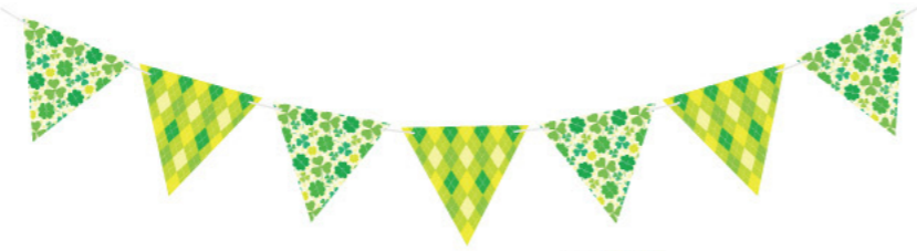
5 016261 クローバーミニフラッグ H20×L180cm 1本 ¥1,280 紙・紐 出荷単位:1