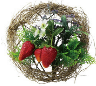
2 010019 ストロベリーリースアレンジ H15×W15 1コ ¥1,800 シルク・ポリエステル・スチロール・木 出荷単位:1