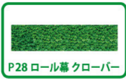
P28 ロール幕 クローバー