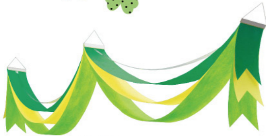
4 010802 ウェーブベナント線 H30×W10×L180cm 1コ ¥1,980 不織布 出荷単位:1