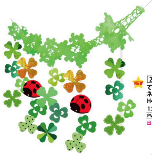
2 011510 てんとう虫クローバー ネットガーランド H45×W24×L180cm 1コ ¥1,800 PVC・不織布・紙 出荷単位:1