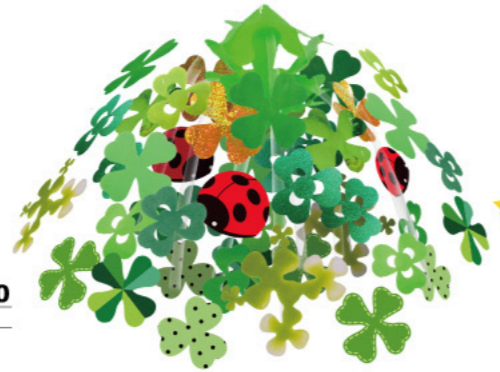
3 011511 てんとう虫クローバー ドロッブ H60×W60cm 1コ ¥2,300 PVC・不織布・紙 出荷単位:1