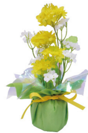
5 011508 菜の花ポット H30×W20・底φ10cm 1コ ¥2,800 ポリエステル・スチロール 出荷単位:1