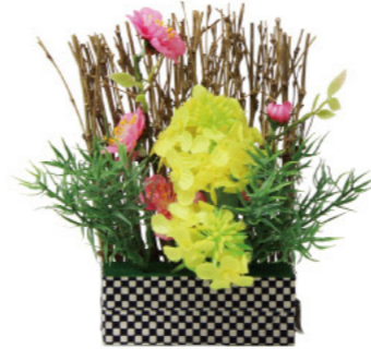
4 010022 ミニフェンスアレンジ 菜の花 H20×W18×D9cm 1コ ¥2,000 ポリエステル・シルク・スチロール 出荷単位:1