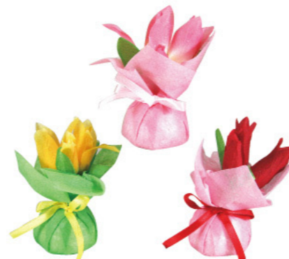
7 012580 ミニミニポットチューリップ H13×W11cm 1コ ¥160 ポリエステル・スチロール・不織布 出荷単位:アソート24 24/288