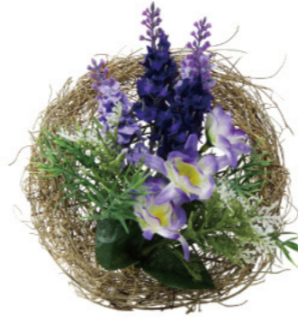
1 010018 ラベンダーリースアレンジ H15×W15 1コ ¥1,700 シルク・ポリエステル・スチロール・木 出荷単位:1