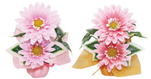
6 012584 ガーベラプチポット H16×W15×D12cm 1コ ¥360 ポリエステル・不織布 出荷単位:アソート12 12/144