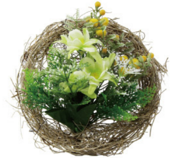
3 010020 ミモザリースアレンジ H15×W15 1コ ¥1,700 シルク・ポリエステル・木 出荷単位:1