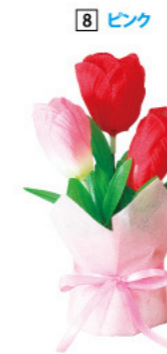
8 012567 チューリッププチポット H19×W12×D10cm 花φ4cm・底φ7cm 1コ ¥380 ポリエステル・スチロール・不織布 出荷単位:12 12/144