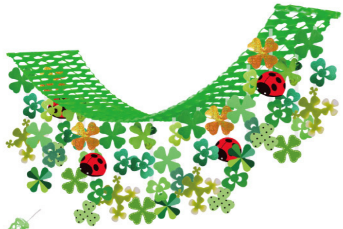
1 011509 てんとう虫クローバー ブリーツハンガー H45×W45×L180cm 1コ ¥2,800 PVC・PET・不織布・紙 出荷単位:1