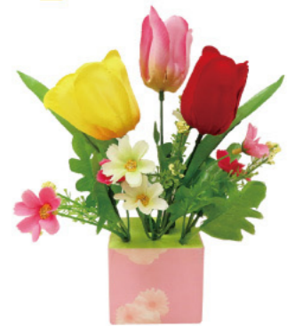
10 012018 チューリップBOXポット H23×W23cm 1コ ¥1,200 ポリエステル・スチール 発泡スチロール・紙 出荷単位:1