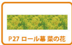
P27 ロール幕 菜の花

1 012163 菜の花垣根アレンジ H35×W52×D19cm 1コ ¥3,800 スチロール・エスレン・スチール・布・紙 出荷単位:1 片面