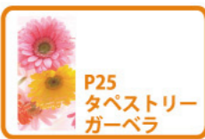
P25 タペストリーガーベラ