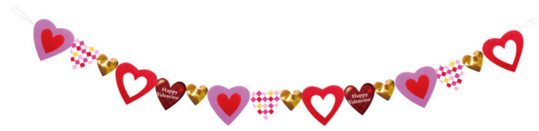
★ 6 011506 ドキドキバレンタインコンティニュー H15×W130cm 1本 ¥1,800 PVC・不織布・紙 出荷単位:1