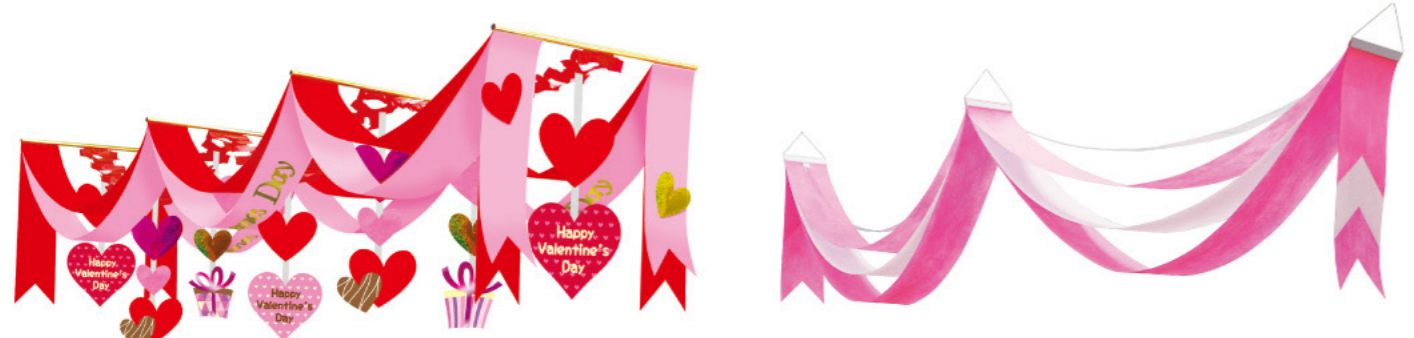
4 001111 ラブリイギフトバレンタインDXペナント H44×W40×L180cm 1コ ¥4,200 PE・ABS・不織布・紙 出荷単位:1