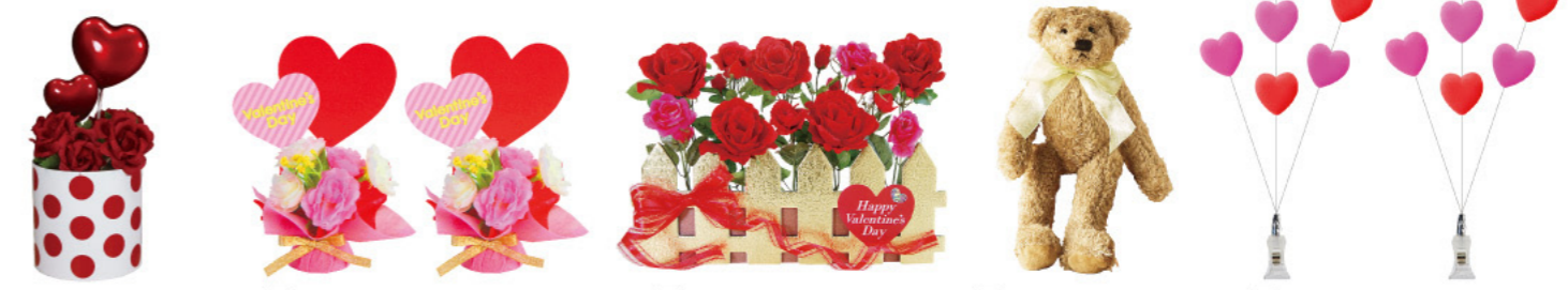
5 014450d バレンタインミニポットレッド H15×W7×D7cm 1コ ¥380 ポリエステル・スチロール・紙 出荷単位:1