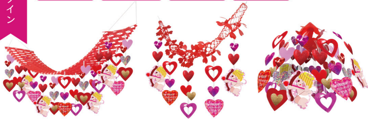
★ 1 011502 レッドキュービッドブリーツハンガー H45×W45×L180cm 1コ ¥2,800 PVC・PET・不織布・紙 出荷単位:1