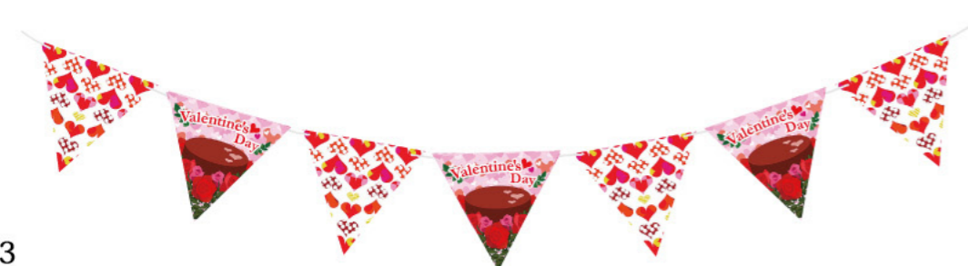
8 016262 バレンタインミニフラッグ H20×L180cm 1本 ¥1,280 紙・紐 出荷単位:1 6/CTN