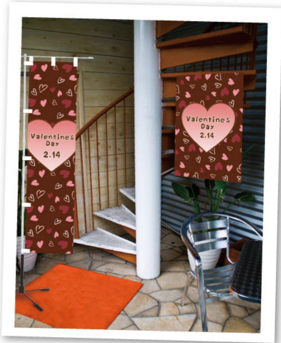
★ 11 013701 ハーフタペストリー ハートバレンタイン H90×W60cm 1枚 ¥2,700 ポリエステル 出荷単位:1 上下パイプ・上部ひも付き