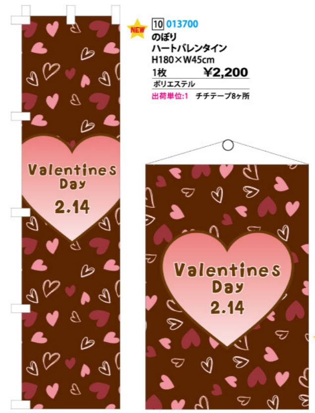
★ 10 013700 のぼり ハートバレンタイン H180×W45cm 1枚 ¥2,200 ポリエステル 出荷単位:1 チチテープ8ヶ所