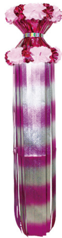
4 021049 レッド