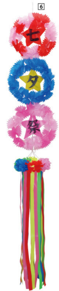
6 025123 七夕祭リング吹き流し H180×Φ30cm 1コ ¥4,900 ビニール 出荷単位:1 上部ひも付