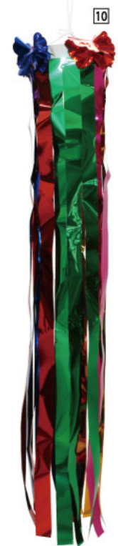
10 025466 花付三尺メッキ 五色吹き流し H90×Φ22cm 1コ ¥780 ビニール 出荷単位:1 上部ひも付 赤・青・ゴールド・緑・ピンク