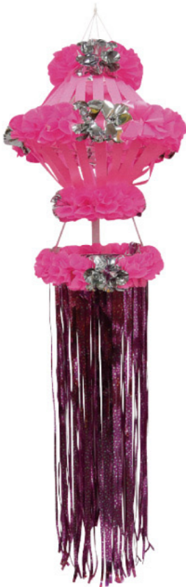
7 026217 ピンク