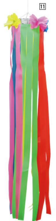
11 025467 花付三尺ビニール 五色吹き流し H90×Φ22cm 1コ ¥580 ビニール 出荷単位:1 上部ひも付 赤・青・黄・緑・ピンク