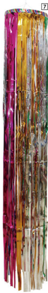
7 025463 六尺メッキ五色吹き流し H180×Φ30cm 1コ ¥1,500 ビニール 出荷単位:1 上部ひも付 赤・青・ゴールド・緑・ピンク