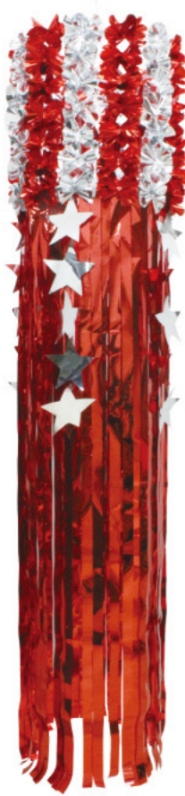
1 025120 レッド