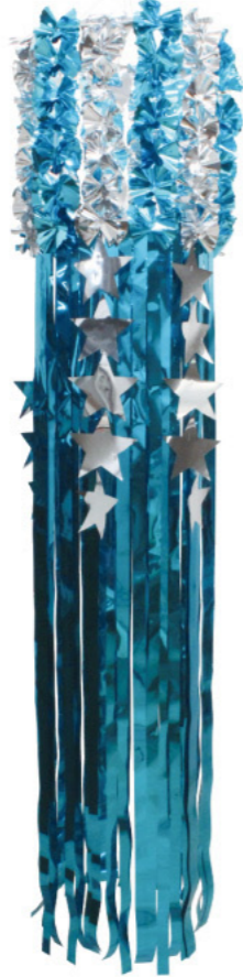
3 025121 ブルー