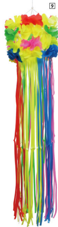
9 025472 フラワーポット吹き流し H110×Φ30cm 1コ ¥2,100 ビニール 出荷単位:1 上部ひも付