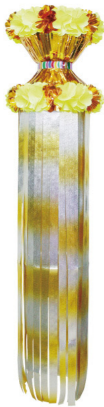
5 021048 イエロー