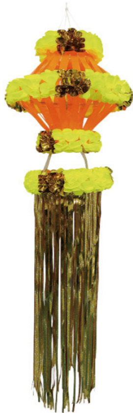
8 026216 イエロー