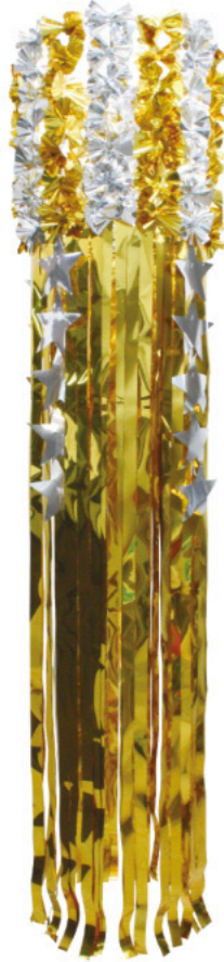
2 025122 ゴールド