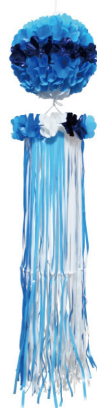
3 025470 ブルー