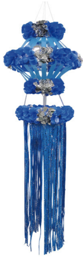
9 026215 ブルー