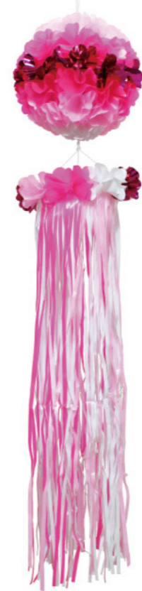
1 025468 ピンク