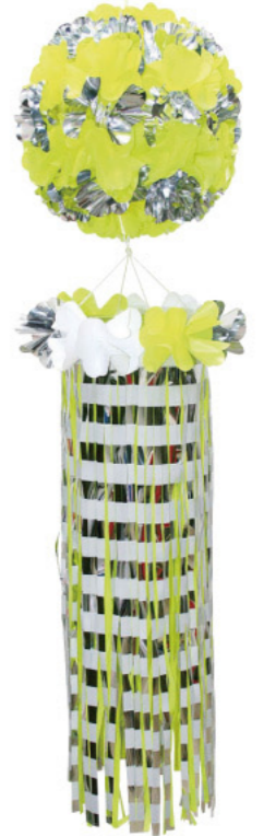
5 021051 イエロー