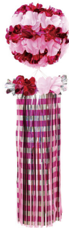
4 021052 レッド