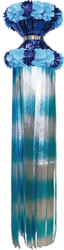
6 021050 ブルー