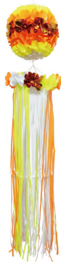
2 025469 イエロー