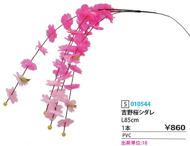
5 010544 吉野桜シダレ L85cm 1本 ¥860 PVC 出荷単位:10