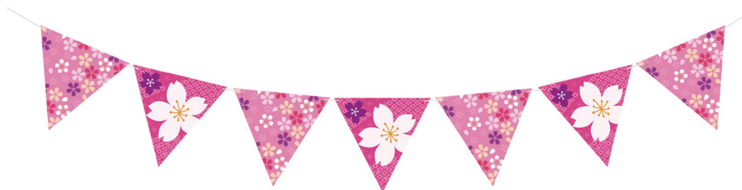
3 010541 雅桜フラッグ H20×L180cm 1コ ¥1,280 紙・ひも 出荷単位:1