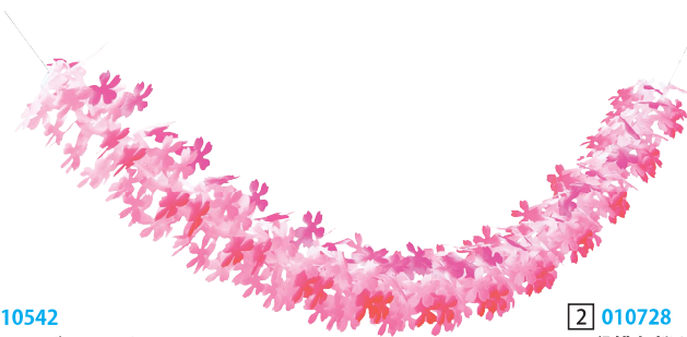
2 010728 25段桃色桜ガーランド W25×L180cm 1コ ¥1,500 不織布 出荷単位:1