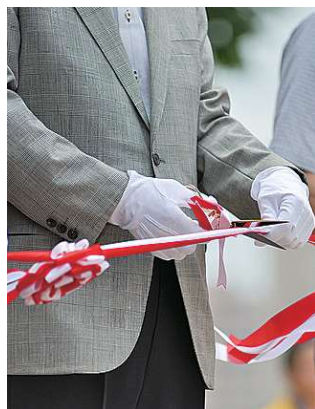
15 000983 赤 16 000984 白 24mmコハクリボンテープ W24mm・L29m 1巻 ¥780 レーヨン 出荷単位:10