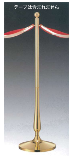
10 000933 テープカットボール(大) H110cm・ベースΦ30cm パイプ径Φ6cm・6kg 1本 ¥50,000 真鍮 出荷単位:1 送料別商品