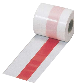
19 000640 厚手ポリ紅白足巻50m巻 W75mm・厚さ0.07mm 1巻 ¥1,100 ポリエチレン 出荷単位:1