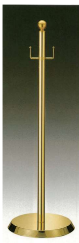
11 055901 テープカットボール(中) H90cm・ベースΦ30cm パイプ径Φ3.2cm・5.2kg 1本 ¥31,000 真鍮 出荷単位:1 送料別商品