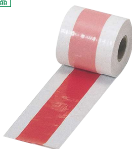
18 000625 ポリ紅白足巻80m巻 W75mm・厚さ0.05mm 1巻 ¥1,400 ポリエチレン 出荷単位:5