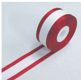
17 000980 1.5"赤耳リボン W36mm・L29m 1巻 ¥1,500 レーヨン・ナイロン 出荷単位:5