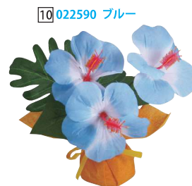
[10] 022590 ブルー