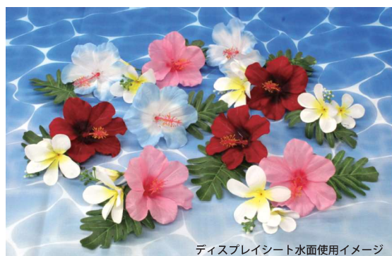
ディスプレイシート水面使用イメージ