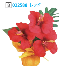
[8] 022588 レッド