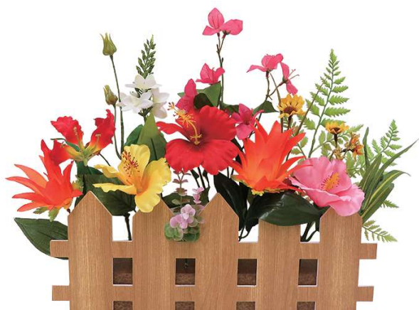
[4] 022017 ハイビスカス垣根アレンジ H38×W51cm 1コ ¥3,900 エスレン・スチロール・ポリエステル・紙 出荷単位:1