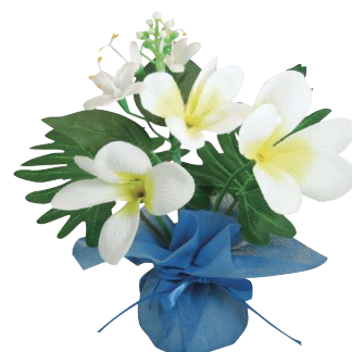
[6] 022600 ミニミニポットプルメリア H17×W13×D13cm 1コ ¥180 ポリエステル・スチロール・不織布 出荷単位:24 24/288