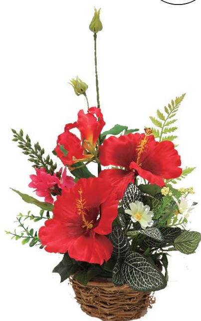
[5] 022026 ハイビスカス盛カゴ H37×W23cm 1コ ¥3,000 ポリエステル・スチロール 出荷単位:1