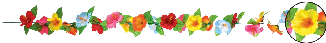
[1] 022576 ハイビスカスカラフルガーランド L180cm・花Φ10cm 1本 ¥1,500 ポリエステル 出荷単位:12 12/96