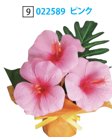
[9] 022589 ピンク