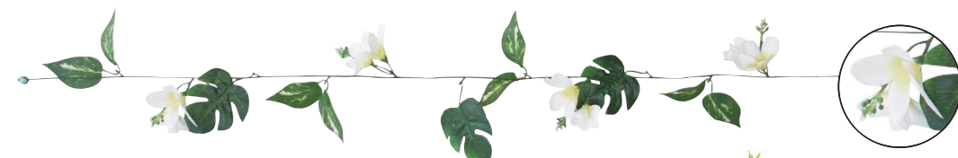
[3] 022598 ショートガーランド プルメリア L115cm・花Φ7~8cm 1本 ¥200 ポリエステル 出荷単位:24 24/288