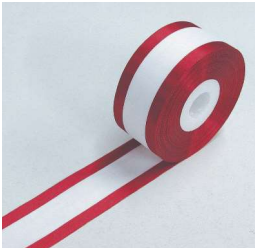
17 000980 1.5"赤耳リボン W36mm・L29m 1巻 ¥1,500 レーヨン・ナイロン 出荷単位:5