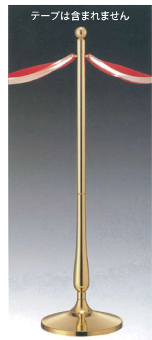
テープは含まれません