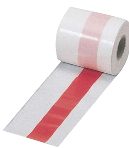
19 000640 厚手ポリ紅白足巻50m巻 W75mm・厚さ0.07mm 1巻 ¥1,100 ポリエチレン 出荷単位:1