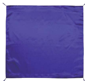
7 055089 紫ふくさ H43×W43cm 1枚 ¥4,200 サテン 出荷単位:1