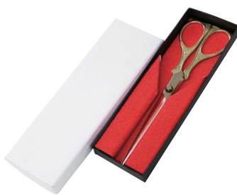
2 056300 ゴールドハサミ L20cm・刃渡り9cm 1本 ¥5,500 表面:金メッキ・刃:ステンレス 出荷単位:1