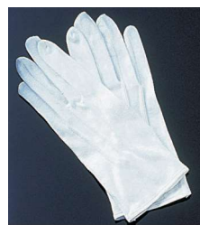
8 000672 手袋 フリーサイズ・ホック付 1双 ¥500 綿 出荷単位:12 480/CTN