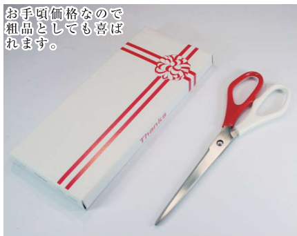
1 056231 紅白ハサミ H18.5cm・刃渡り8cm 1本 ¥1,150 刃:ステンレス・柄:ABS 出荷単位:1