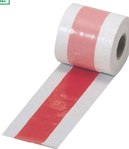
18 000625 ポリ紅白足巻80m巻 W75mm・厚さ0.05mm 1巻 ¥1,400 ポリエチレン 出荷単位:5