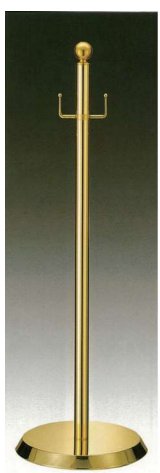
11 055901 テープカットボール(中) H90cm・ベースΦ30cm パイプ径Φ3.2cm・5.2kg 1本 ¥31,000 真鍮 出荷単位:1 送料別商品