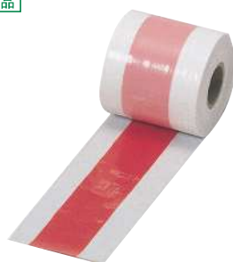
18 000625 ポリ紅白足巻80m巻 W75mm・厚さ0.05mm 1巻 ¥1,400 ポリエチレン 出荷単位:5