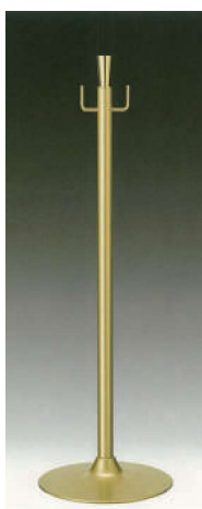
12 055900 テープカットボール(小) H80cm・ベースΦ28cm パイプ径Φ3.2cm・3.6kg 1本 ¥14,500 真鍮 出荷単位:1 送料別商品