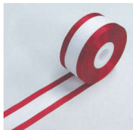
17 000980 1.5"赤耳リボン W36mm・L29m 1巻 ¥1,500 レーヨン・ナイロン 出荷単位:5