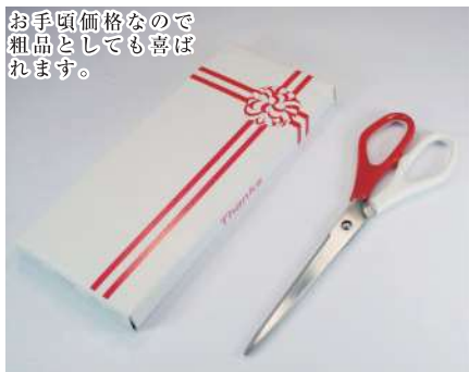
1 056231 紅白ハサミ H18.5cm・刃渡り8cm 1本 ¥1,150 刃:ステンレス・柄:ABS 出荷単位:1