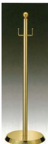
11 055901 テープカットボール(中) H90cm・ベースΦ30cm パイプ径Φ3.2cm・5.2kg 1本 ¥31,000 真鍮 出荷単位:1 送料別商品