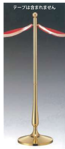
10 000933 テープカットボール(大) H110cm・ベースΦ30cm パイプ径Φ6cm・6kg 1本 ¥50,000 真鍮 テープは含まれません 出荷単位:1 送料別商品