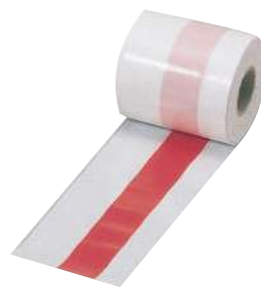
19 000640 厚手ポリ紅白足巻50m巻 W75mm・厚さ0.07mm 1巻 ¥1,100 ポリエチレン 出荷単位:1