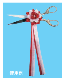
3 054450 ハサミ用リボン L23cm・花Φ5.5cm 1コ ¥710 レーヨン 出荷単位:24