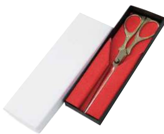
2 056300 ゴールドハサミ L20cm・刃渡り9cm 1本 ¥6,300 表面:金メッキ・刃:ステンレス 出荷単位:1