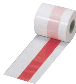
19 000640 厚手ポリ紅白足巻50m巻 W75mm・厚さ0.07mm 1巻 ¥1,300 ポリエチレン 出荷単位:1