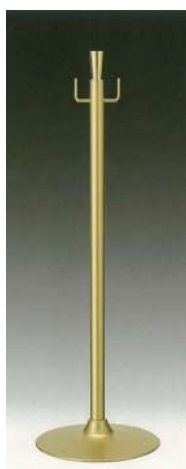
12 055900 テープカットボール(小) H80cm・ベースΦ28cm パイプ径Φ3.2cm・3.6kg 1本 ¥21,000 真鍮 出荷単位:1 送料別商品