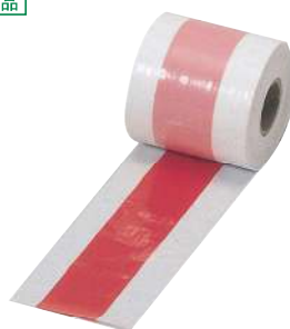
18 000625 ポリ紅白足巻80m巻 W75mm・厚さ0.05mm 1巻 ¥1,400 ポリエチレン 出荷単位:5