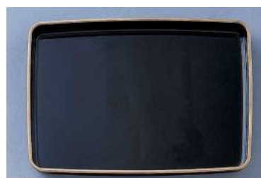
9 054552 プラスチック賞状盆 H4.5×W45×D31cm 1コ ¥9,800 プラスチック 出荷単位:1