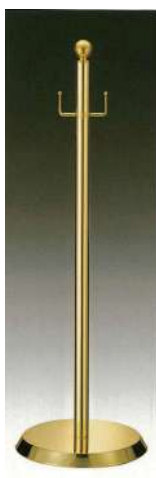
11 055901 テープカットボール(中) H90cm・ベースΦ30cm パイプ径Φ3.2cm・5.2kg 1本 ¥38,000 真鍮 出荷単位:1 送料別商品