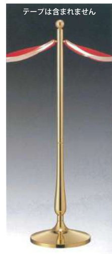
10 000933 テープカットボール(大) H110cm・ベースΦ30cm パイプ径Φ6cm・6kg 1本 ¥58,000 真鍮 出荷単位:1 送料別商品