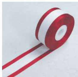
17 000980 1.5"赤耳リボン W36mm・L29m 1巻 ¥1,700 レーヨン・ナイロン 出荷単位:5