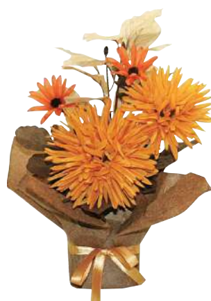
[4] 032558 オータムフラワーポット H27×W20×D18cm 1コ ¥500 ポリエステル・スチロール・不織布 出荷単位:12 12/144 3タイプアソート