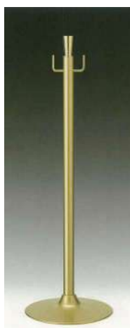
[11] 055900 テープカットボール(小) H80cm・ベースΦ28cm パイプ径Φ3.2cm・3.6kg 1本 ¥21,000 スチール製 出荷単位:1 送料別商品