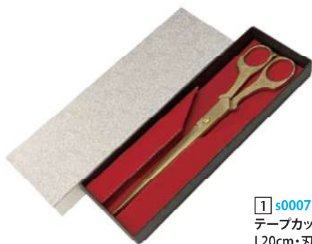
[1] s000773 テープカットハサミゴールド L20cm・刃渡り10cm 1本 ¥4,800 スチール・金塗装 出荷単位:1