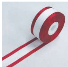
[16] 000980 1.5"赤耳リボン W36mm・L29m 1巻 ¥1,700 レーヨン・ナイロン 出荷単位:5