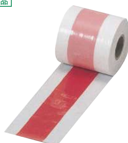
[17] 000625 ポリ紅白足巻80m巻 W75mm・厚さ0.05mm 1巻 ¥1,400 ポリエチレン 出荷単位:5