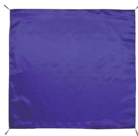
[6] 055089 紫ふくさ H43×W43cm 1枚 ¥5,000 サテン 出荷単位:1