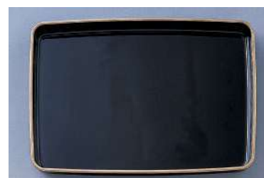
[8] 054552 プラスチック賞状盆 H4.5×W45×D31cm 1コ ¥9,800 プラスチック 出荷単位:1