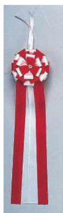
[3] 000039 テープカトリボン(大) L60cm・花Φ16cm 1コ ¥3,440 アセテート 出荷単位:2 両面 [4] 000040 テープカトリボン(中) L50cm・花Φ12cm 1コ ¥2,360 アセテート 出荷単位:5 両面 [5] 000041 テープカトリボン(小) L42cm・花Φ10cm 1コ ¥1,580 アセテート 出荷単位:8 両面