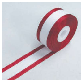
[16] 000980 1.5"赤耳リボン W36mm・L29m 1巻 ¥1,700 レーヨン・ナイロン 出荷単位:5