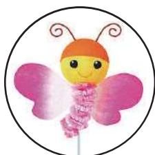
4 010743 蝶々クリップ2本セット H29×W8.5cm 1セット ¥1,600 ABS・PS 出荷単位:1