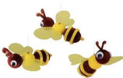
2 010764 15cmミツバチ 3 個セット H20×W15cm 1セット ¥3,600 PS・PVC 出荷単位:1