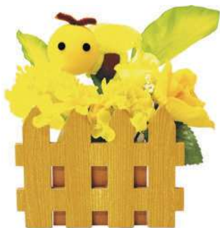
1 010763 菜の花垣根POP H18×W15×D8cm 1コ ¥1,800 出荷単位:1