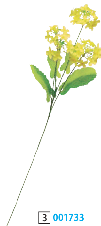
3 001733 菜の花×4輪 L55cm・花房大Φ7cm×2輪・ 小Φ5cm×2輪 1本 ¥340 ポリエステル 出荷単位:36 36/720