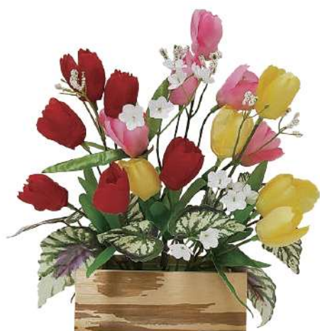
6 012168 チューリップウッドアレンジ H25×W23cm 1コ ¥3,000 布・紙・スチロール・スチレン・エスレン 出荷単位:1