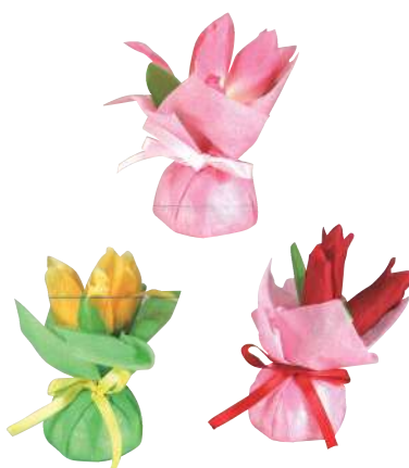
7 012580 ミニミニポットチューリップ H13×W11cm 1コ ¥200 ポリエステル・スチロール・不織布 出荷単位:アソート24 24/288