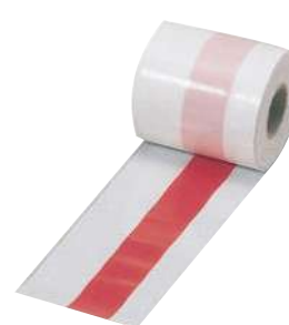
[18] 000640 厚手ポリ紅白足巻50m巻 W75mm・厚さ0.07mm 1巻 ¥1,500 ポリエチレン 出荷単位:1