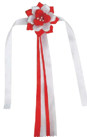
[2] 054450 ハサミ用リボン L23cm・花Φ5.5cm 1コ ¥710 レーヨン 出荷単位:②4