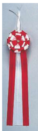
[3] 000039 テープカトリボン(大) L60cm・花Φ16cm 1コ ¥3,970 アセテート 出荷単位:② 両面 [4] 000040 テープカトリボン(中) L50cm・花Φ12cm 1コ ¥2,720 アセテート 出荷単位:⑤ 両面 [5] 000041 テープカトリボン(小) L42cm・花Φ10cm 1コ ¥1,820 アセテート 出荷単位:⑧ 両面