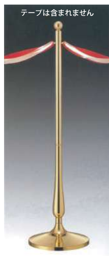
[9] 000933 テープカットボール(大) H110cm・ベースΦ30cm パイプ径Φ6cm・6kg 1本 ¥58,000 真鍮・スチール製 出荷単位:1 送料別商品