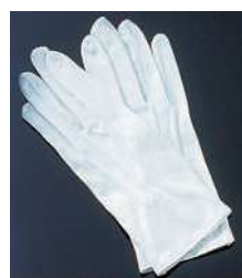
[7] 000672 手袋 フリーサイズ・ホック付 1双 ¥670 綿 出荷単位:⑫ 480/CTN