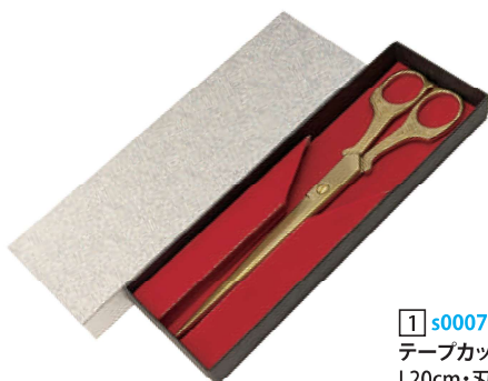
[1] s000773 テープカットハサミゴールド L20cm・刃渡り10cm 1本 ¥4,800 スチール・金塗装 出荷単位:1