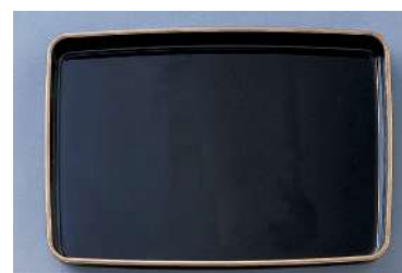
[8] 054552 プラスチック賞状盆 H4.5×W45×D31cm 1コ ¥9,800 プラスチック 出荷単位:1