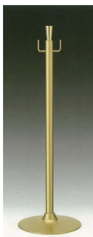
[11] 055900 テープカットボール(小) H80cm・ベースΦ28cm パイプ径Φ3.2cm・3.6kg 1本 ¥21,000 スチール製 出荷単位:1 送料別商品