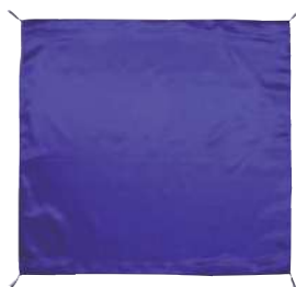
[6] 055089 紫ふくさ H43×W43cm 1枚 ¥5,000 サテン 出荷単位:1