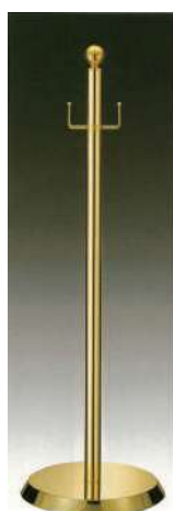
[10] 055901 テープカットボール(中) H90cm・ベースΦ30cm パイプ径Φ3.2cm・5.2kg 1本 ¥38,000 スチール製 出荷単位:1 送料別商品