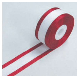
[16] 000980 1.5"赤耳リボン W36mm・L29m 1巻 ¥1,700 レーヨン・ナイロン 出荷単位:⑤